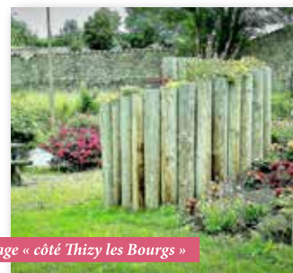
Entrée du village « côté Thizy les Bourgs »

De nouvelles structures en rondins ont été fabriquées et installées par l'équipe technique aux deux entrées du village.