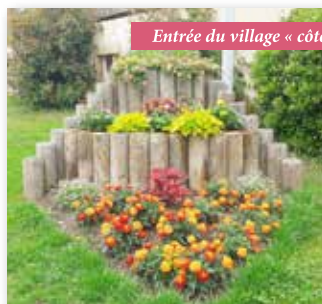
Entrée du village « côté Amplepuis »

Les récompenses changent également. Jusqu'à présent, elles étaient composées seulement de bons d'achat pour l'achat de graines et fleurs. Désormais, elles sont diversifiées : bons d'achat (1 er prix), panier garni de produits locaux (2 ème et 3 ème prix), panier de graines (4 ème et 5 ème prix) et plante (6 ème prix...).