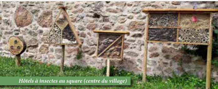
Hôtels à insectes au square (centre du village)