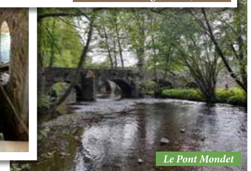
Le Pont Mondet

L'association est ouverte à tous. Elle invite chacun à apporter selon ses possibilités, son soutien humain, matériel ou financier pour faire de ce lieu un témoignage du passé.