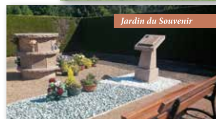
Jardin du Souvenir

La commission a aménagé cet espace existant au cimetière (Lieu-dit « Goutaillard »).