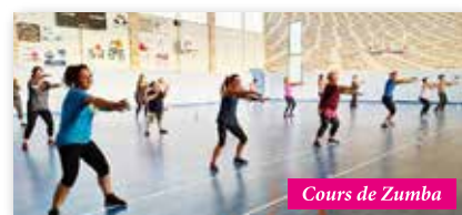
Cours de Zumba

STEP CARDIO - TRAMPOLINE STEP FREESTYLE - RENFO - YOGA PILATES - COUNTRY DANSE EN LIGNE - ZUMBA