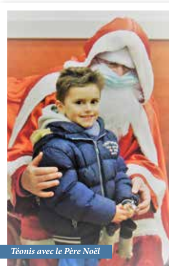
Téonis avec le Père Noël

Les familles ont eu à cœur de se retrouver et d'affectionner ces valeurs de partage et de bonne humeur.