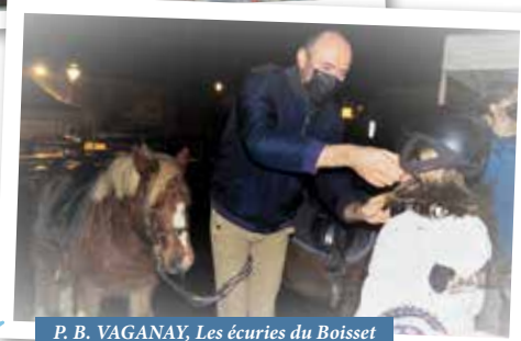
P. B. VAGANAY, Les écuries du Boisset

La 2 ème adjointe et son équipe de la commission « embellissement du village » remercient le soutien et l'implication de chacun et de la collecte reversée au Téléthon (520 €).