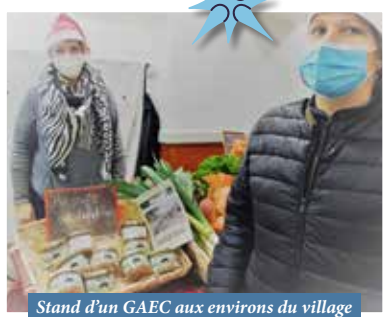
Stand d'un GAEC aux environs du village

Un peu plus de 300 personnes sont venues flâner entre la quinzaine d'artisans et commerçants de la commune et des communes voisines. Chacun a pu apprécier la diversité des stands des exposants aux sons des chants de Noël.