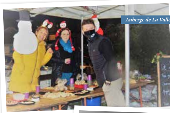
Auberge de La Vallée

La 2 ème adjointe et son équipe de la commission « embellissement du village » remercient le soutien et l'implication de chacun et de la collecte reversée au Téléthon (520 €).